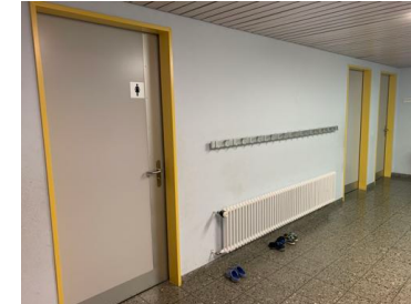
Eingangsbereich (Maskenpflicht) Garderobe Schuhe/Socken/Jacken WC's