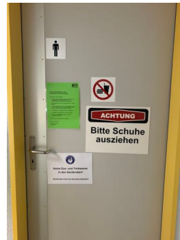
Zutritt Umkleide Männer (Maskenpflicht)