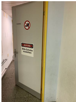
Zutritt Umkleiden (Maskenpflicht)