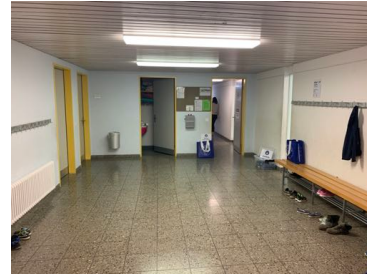
Eingangsbereich (Maskenpflicht) Garderobe Schuhe/Socken/Jacken