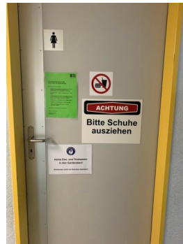
Zutritt Umkleide Frauen (Maskenpflicht)