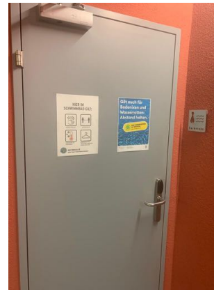
Umkleide Frauen rechts