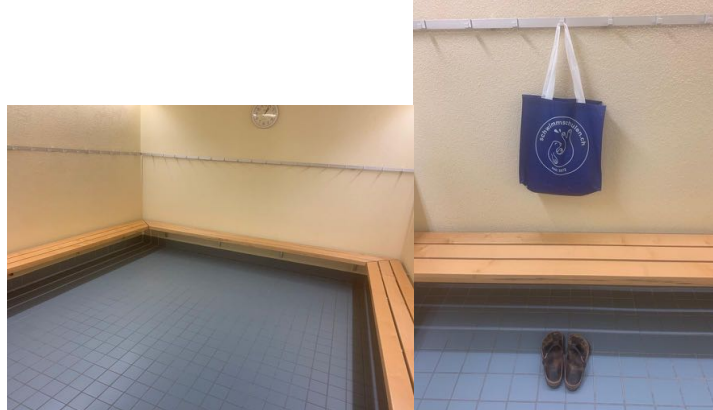
Umkleide Badebekleidung bereits zu Hause anziehen Alles in Tasche verstauen, an Hacken aufhängen Aufenthalt so kurz wie nötig halten