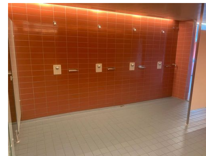
Duschen Kurzes Abduschen vor und nach dem Kurs