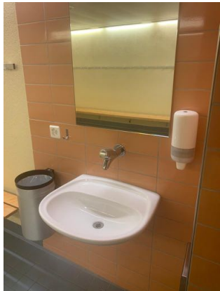
Hände waschen mit Seife in Umkleide