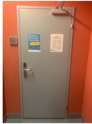
Umkleide Männer links