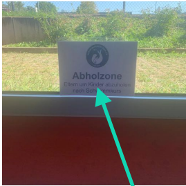
Abholzone Pünktlich zu Kursende

Maskenpflicht für Erwachsene und Kinder über 12 Jahren