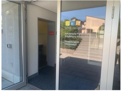
Eingang Primarschulhaus Gässli