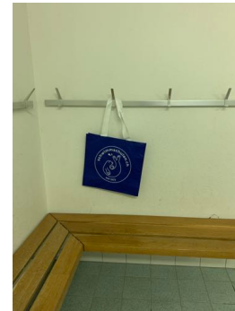
Umkleide Badebekleidung bereits zu Hause anziehen Alles in Tasche verstauen, an Haken aufhängen Aufenthalt so kurz wie nötig halten