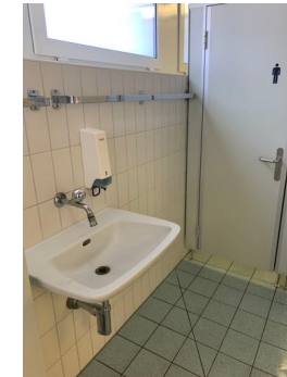
Duschen Hände waschen mit Seife / Duschen Kurzes Abduschen vor und nach dem Kurs 2 WC's