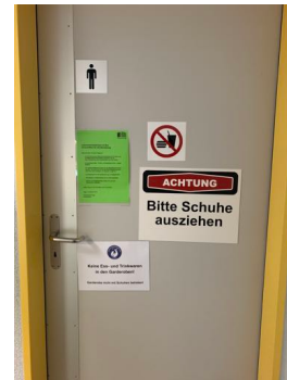
Zutritt Umkleide Männer