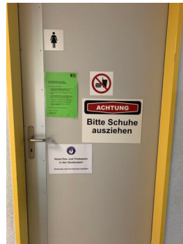
Zutritt Umkleide Frauen