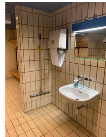
Hände waschen mit Seife / Duschen Kurzes Abduschen vor und nach dem Kurs 2 WC's zur Benutzung zur Verfügung

Badebekleidung bereits zu Hause anziehen Alles in Tasche verstauen, an Haken aufhängen Aufenthalt so kurz wie nötig halten