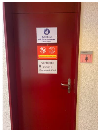
Umkleide Frauen rechts