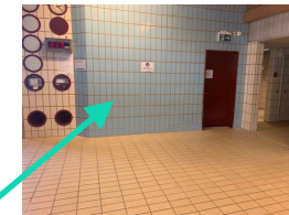
Duschen: kurzes Abduschen vor und nach dem Kurs Zugang Umkleide für nach dem Kurs durch Duschbereich