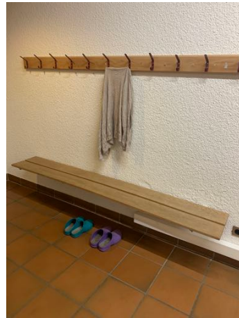
Eingangsbereich Garderobe Schuhe/ Socken und Jacken