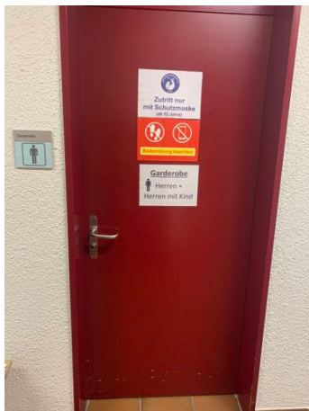
Umkleide Männer links