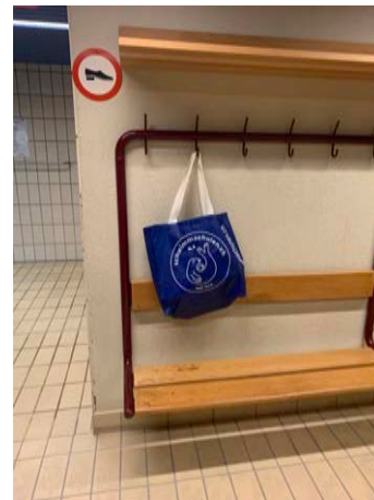
Umkleide Badebekleidung bereits zu Hause anziehen Alles in Tasche verstauen, an Haken aufhängen Aufenthalt so kurz wie nötig halten