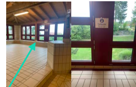
Treffpunkt Babyschwimmen/Mini- Elki/Elki Umziehen/Wickeln Babys