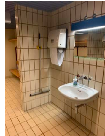
Hände waschen mit Seife / Duschen Kurzes Abduschen vor und nach dem Kurs 2 WC's zur Benutzung zur Verfügung