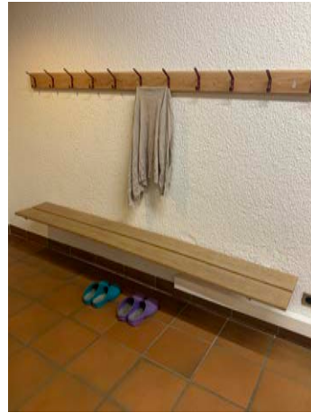
Eingangsbereich (Maskenpflicht) Garderobe Schuhe/ Socken und Jacken