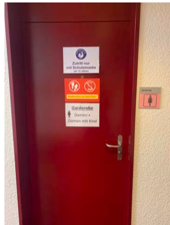
Umkleide Frauen rechts (Maskenpflicht)