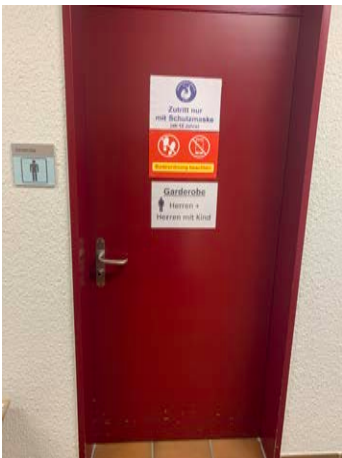
Umkleide Männer links (Maskenpflicht)