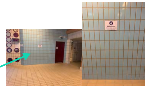
Abholzone pünktlich zu Kursende