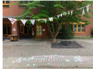
Eingang Samstag (Maskenpflicht)