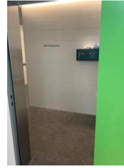
Umkleide Umziehen vor dem Kurs (Maskenpflicht)

Barfusszone: Schuhe abziehen und in Tasche Badebekleidung zu Hause anziehen 3 WC's zur Benützung vorhanden (kein Duschen!) Alles in Tasche verstauen und mitnehmen ins Bad zum Treffpunkt Aufenthalt so kurz wie nötig halten