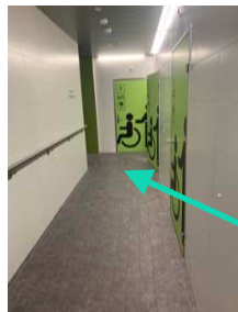
Zugang Bad über Umkleide (Eingang)