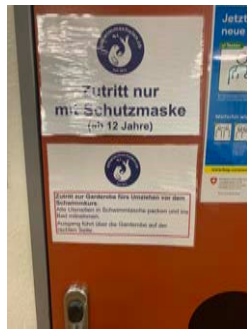
links: Umziehen vor Kurs