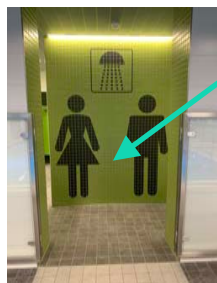
Duschen: kurzes Abduschen vor und nach dem Kurs Zugang Umkleide für nach dem Kurs durch Duschbereich