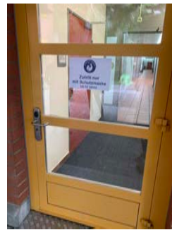
Eingang Samstag (Maskenpflicht)