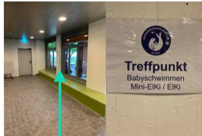
Treffpunkt Babyschwimmen/Mini- Eiki/Eiki Umziehen/Wickeln Babys