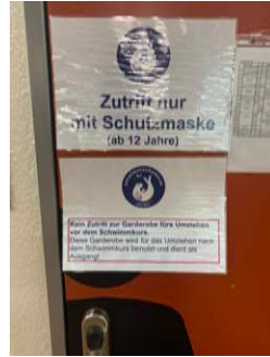
rechts: Umziehen nach Kurs