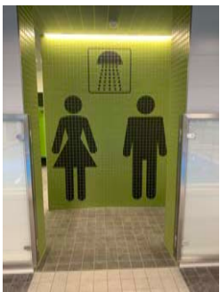
Duschen Kurzes Abduschen vor und nach dem Kurs Duschen nur in den je 3 Kabinen erlaubt