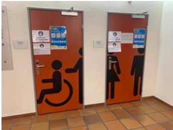
Umkleide (Maskenpflicht) links: Eingang rechts: Ausgang