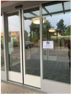
Eingang Freitag (Maskenpflicht)