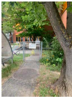
Eingang Samstag (Maskenpflicht)