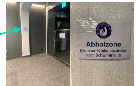
Abholzone pünktlich zu Kursende